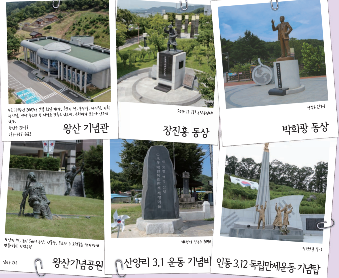
왕산기념관, 장진후 동상, 박희광 동상, 왕산기념공원, 산양리 3.1 운동 기념비

박희광선생 은 독립운동단체 의열단, 대한통부의 부계열 관의단에서 활동하였으며, 임시정부와 함께 조직된 참의부에 가담하여 활동하였다. 김구 선생과 그 측근의 경호를 맡기도 했다. 만주에 있는 선양 총영사관 습격, 천일과 및 고관 암살, 임시정부와 항일독립운동단체에 군자금 및 무기 조달, 남만주철도 일본 군경기습작전 등에 참가하였다.