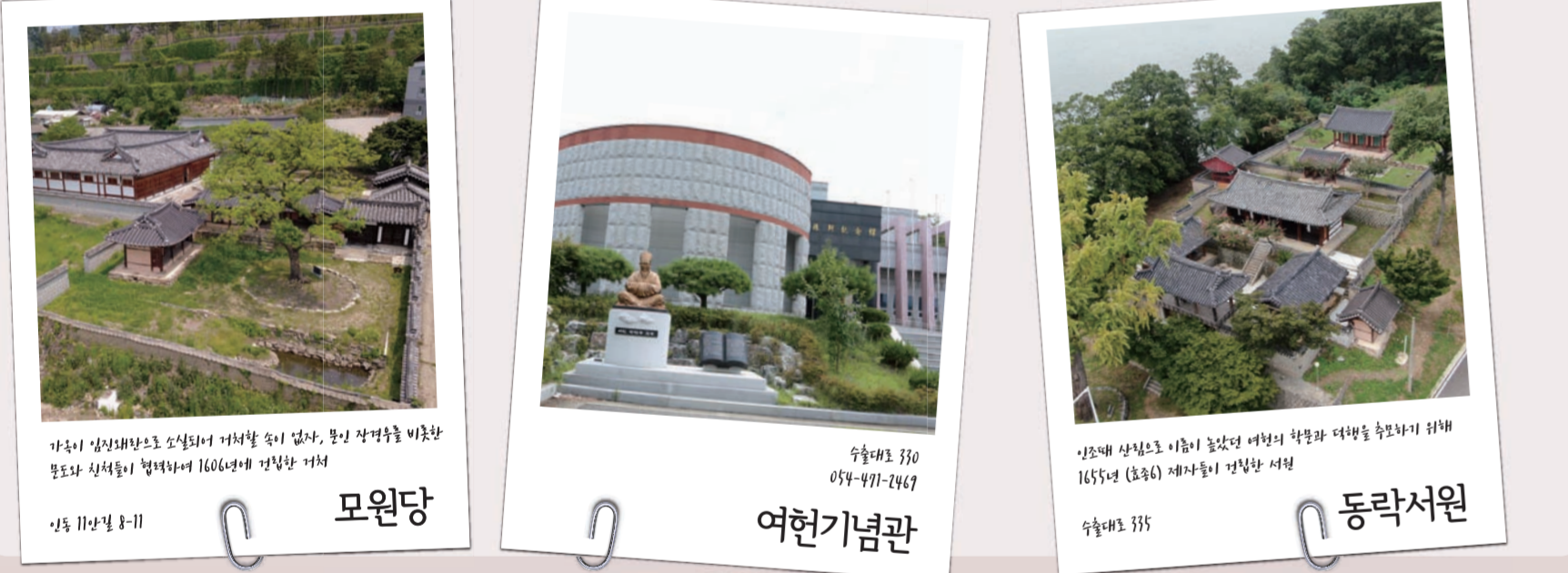
모원당, 여헌기념관, 동락서원

여헌 장현광선생 (1554~1637)은 구미 인동 출신인 조선시대를 대표하는 명유학자다. 여헌은 탕평론(치우침이 없이 공평한 이론)을 내놓아 조선조 성리학계의 거장으로 우뚝 섰다. 과거와 출세에 뜻을 두기보다는 자연에 은거하며 환경생 학문탐구와 후학양성에 힘썼다. 그러한 여헌을 두고 인조는 “500년마다 성현이 한 분씩 난다더니 여헌이 바로 동방의 큰 그릇이요, 천지의 으뜸함을 연구하고 체득하여 통달한 분”이라고 극찬했다.