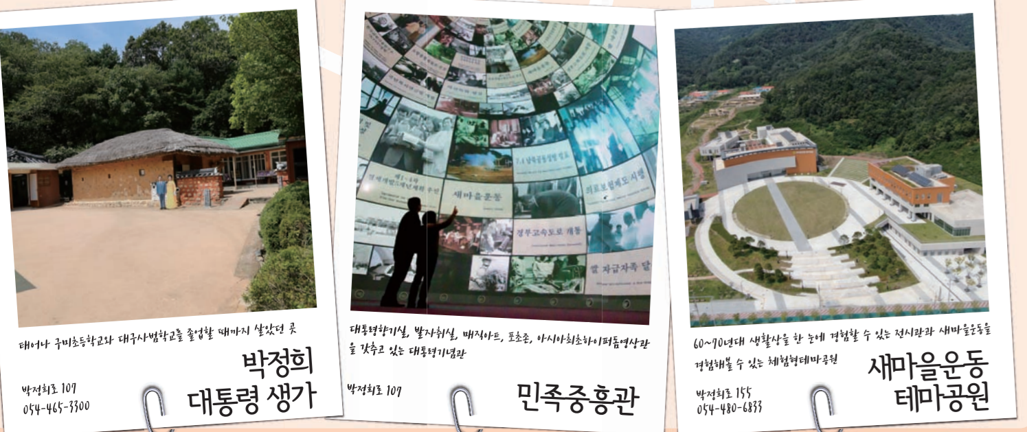
박정희 대통령 생가, 민족중흥관, 새마을운동 테마공원

박정희대통령 (1917.11.14~1979.10.26)은 선산군 구미면 상모리(현 구미시 상모동)출신으로 대한민국 제5대~제9대 대통령을 역임했다. 재임 기간에 경부고속도로건설, 수출증대, 중화학공업육성, 식량 자급자족 실현, 새마을운동 등을 통해 조국 근대화와 비약적인 경제발전을 이룩했다. 보릿고개로 끼니를 걱정했던 세계 최빈국 대한민국 국민들에게 “우리가 하면된다!”는 자신감과 “할 수 있다!”는 신념과 확신을 심어줘 한강의 기적을 이룬 대통령이였다.